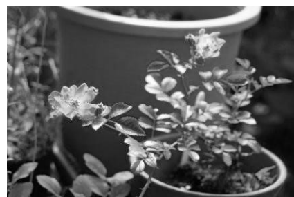
鉢で育てる野バラ