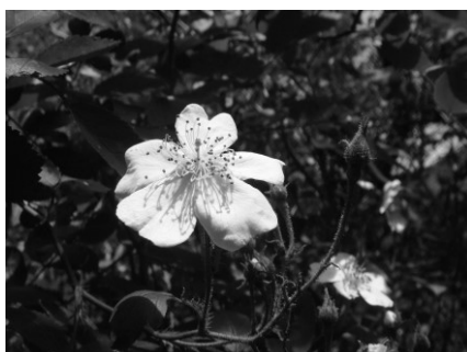
ツクシイバラ(白花) [雑種か?]